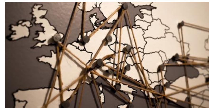
Viaggiare intorno al mondo in un giorno