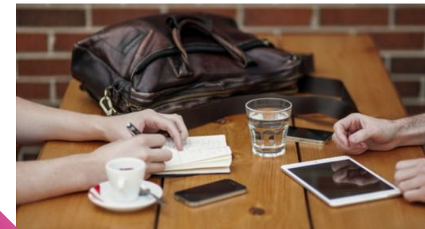
Contri informali per are i contratti