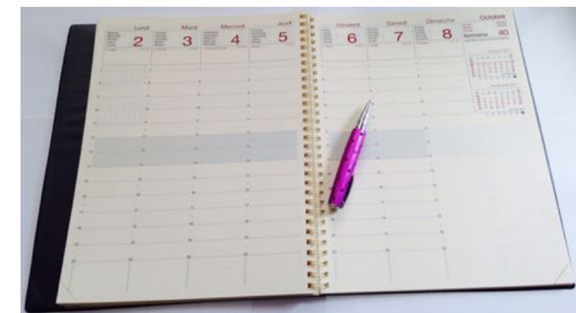
Come scrivere un blog di successo