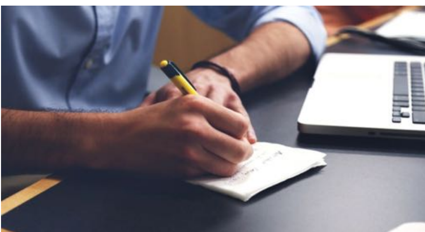
Trasformare idee in progetti