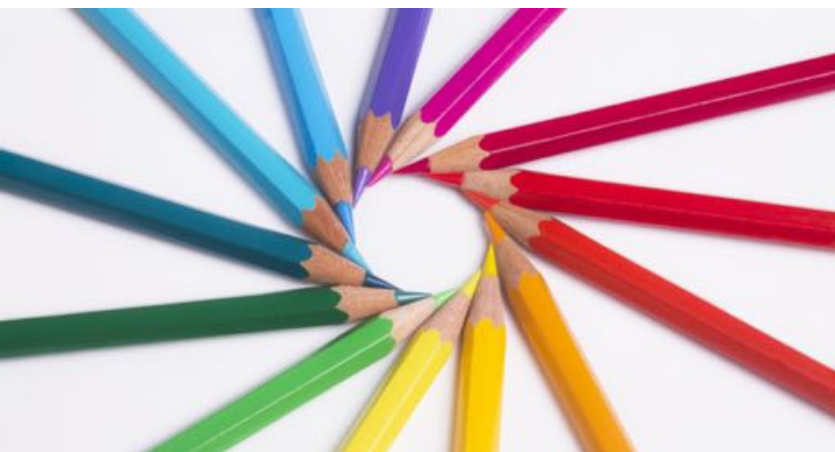
Il potere dei colori sulle vendite online