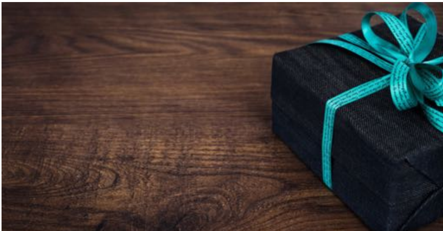
Cosa regalare ai clienti